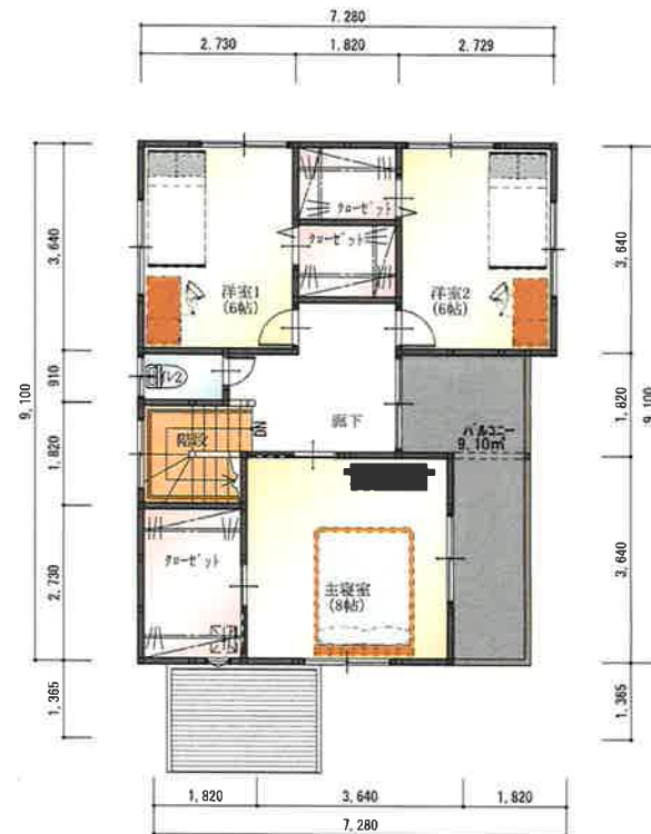
2階 平面図 S:1/100