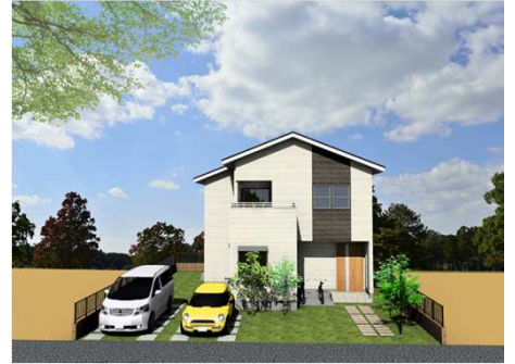
※図面と現況が異なる時は、現況を優先します。

陽当りのいい広いお庭とリビング、和室がつづく 明るい空間で家族みんなの笑顔がこぼれる家。