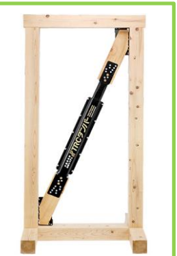
【制振装置TRCダンパー採用】

「特殊粘弾性ゴム」をダンパーに入れ伸び縮みさせることで、地震エネルギーを熱エネルギーに変換吸収します。60年以上の耐久性！メンテナンスフリー！