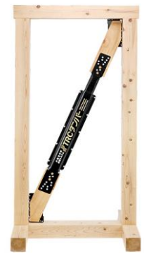
【制振装置TRCダンパー採用】

「特殊粘弾性ゴム」をダンパーに入れ伸び縮みさせることで、地震エネルギーを熱エネルギーに変換吸収します。60年以上の耐久性！メンテナンスフリー！