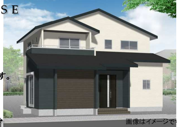
画像はイメージで